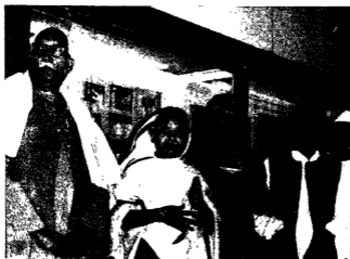
प सुमित्रानन्दन पंत, सुश्री महादेवी वर्मा और गुरुवर हजारीप्रसाद द्विवेदी के साथ प्रफुल्ल मुदा में